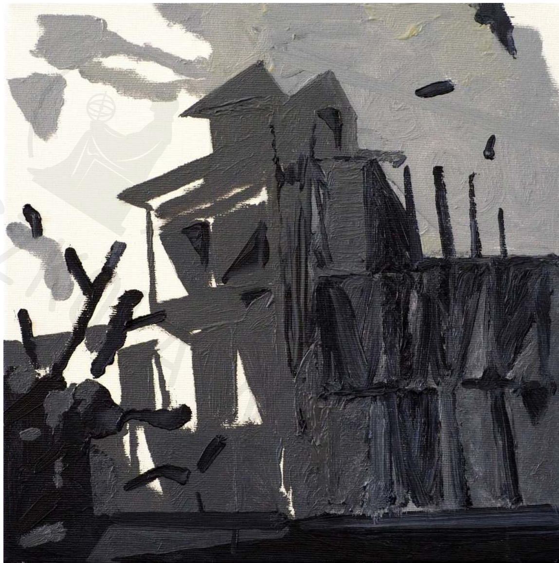
Dom dla przegranej sprawy olej na płótnie 40 x 40 cm 2021