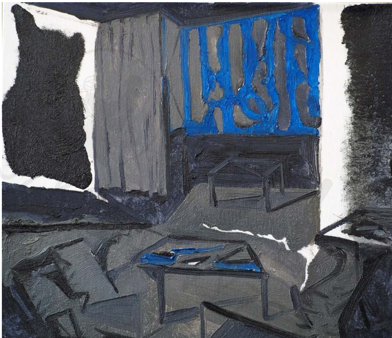
Fatszywy dom olej na płótnie 30 x 30 cm 2018