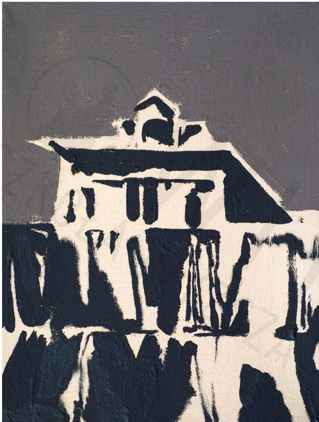
Miejsca, w których nigdy nie mieszkałam olej na płótnie 35 x 45 cm 2020