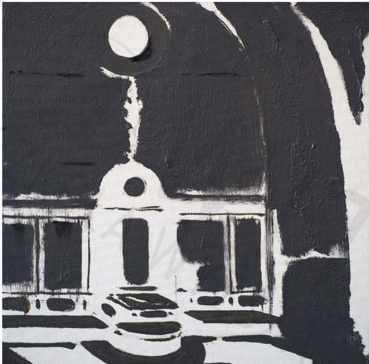
San Miniato al Monte